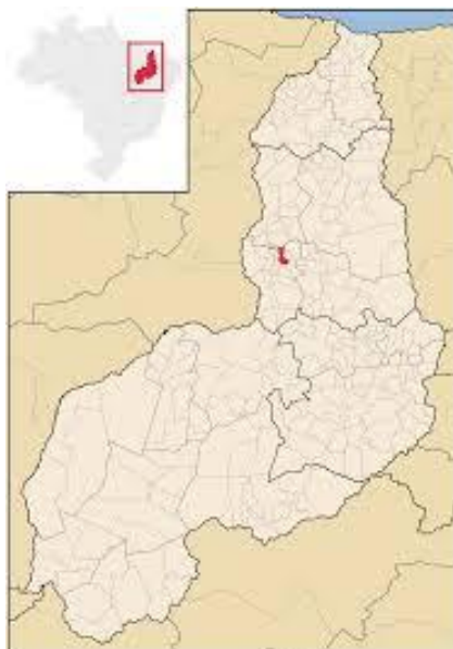
Localização de Olho D'Água do Piauí – PI

O município está localizado na microrregião de Médio Paraíba Piauiense, compreendendo uma área irregular de 218 km 2 , tendo como limites os municípios de Monsenhor Gil a norte, a sul, Hugo Napoleão e Passagem Franca do Piauí, a oeste, Água Branca e Lagoinha do Piauí e, a leste, Barro Duro. A sede municipal tem as coordenadas geográficas de 05°05'29" de latitude sul e 42°34'30" de longitude oeste e dista cerca de 95 km de Teresina.